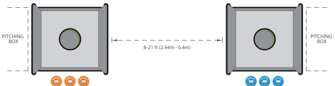
DIAGRAM 1: COURT LAYOUT

GAME SETUP: Locate a level playing area. Place the two targets 8ft (2.44m) apart or up to 21 ft, (6.4m) (see court layout). Depending upon the age or skill of the participants the distance between targets can be modified.